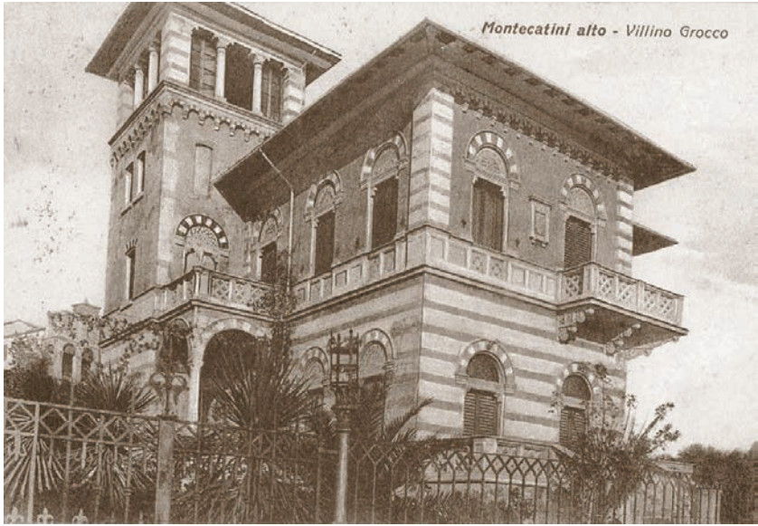
Villino Pietro Grocco Montecatini Alto