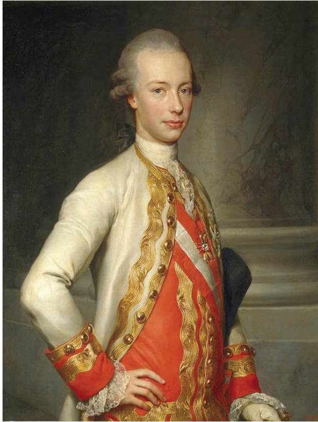
Pietro Leopoldo di Lorena Granduca di Toscana