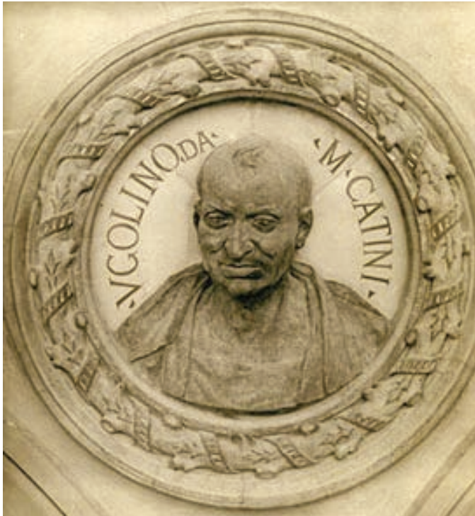
Ugolino Caccini detto Ugolino da Montecatini