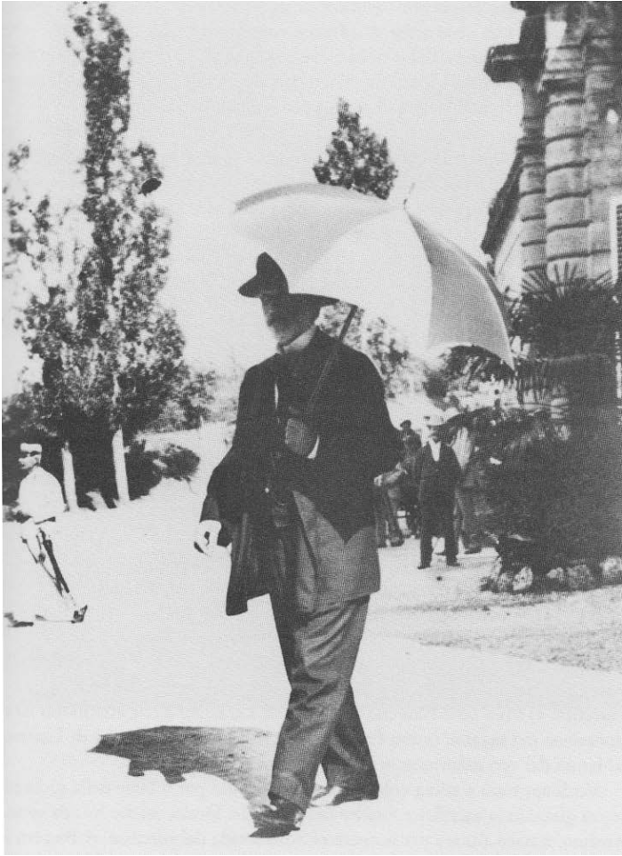
Giuseppe Verdi all'uscita del Tettuccio