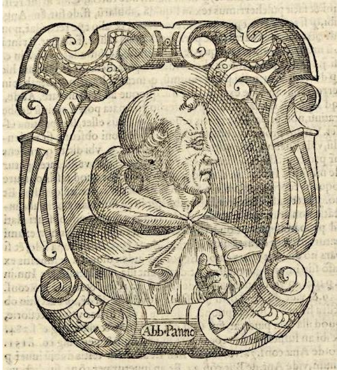
Ser Nicolò Tedeschi