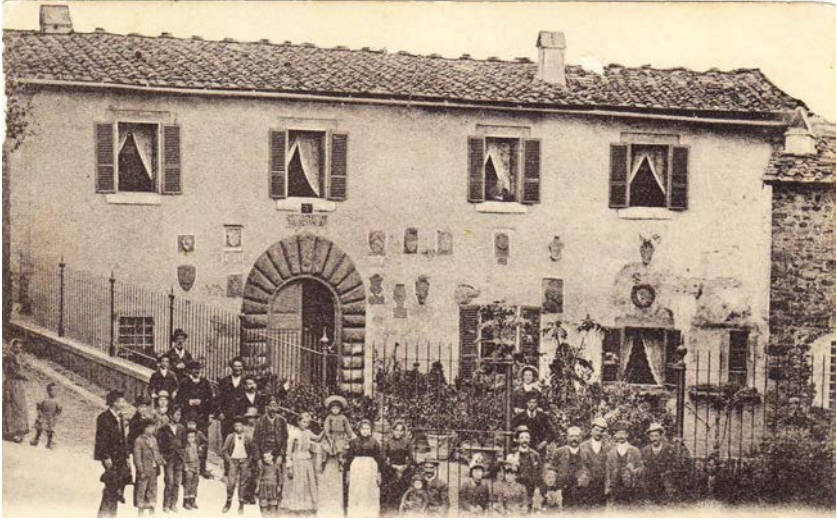
Ser Naddo Antico Palagio dei Podestà