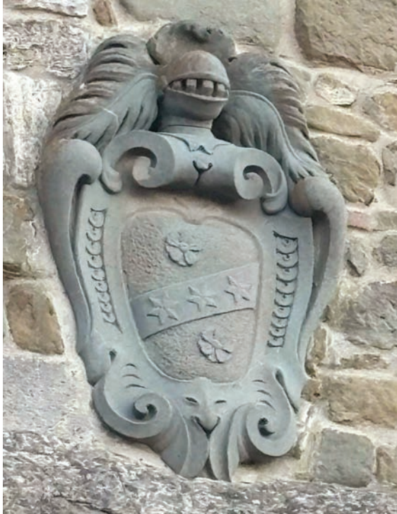
Broccardi Schelmi stemma della famiglia