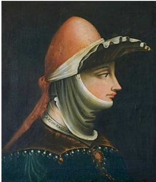
Beatrice di Lotaringia-Matilde di Canossa e Ildebrando Lambardi signore di Maona